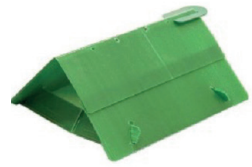
IQ DELTA TRAP