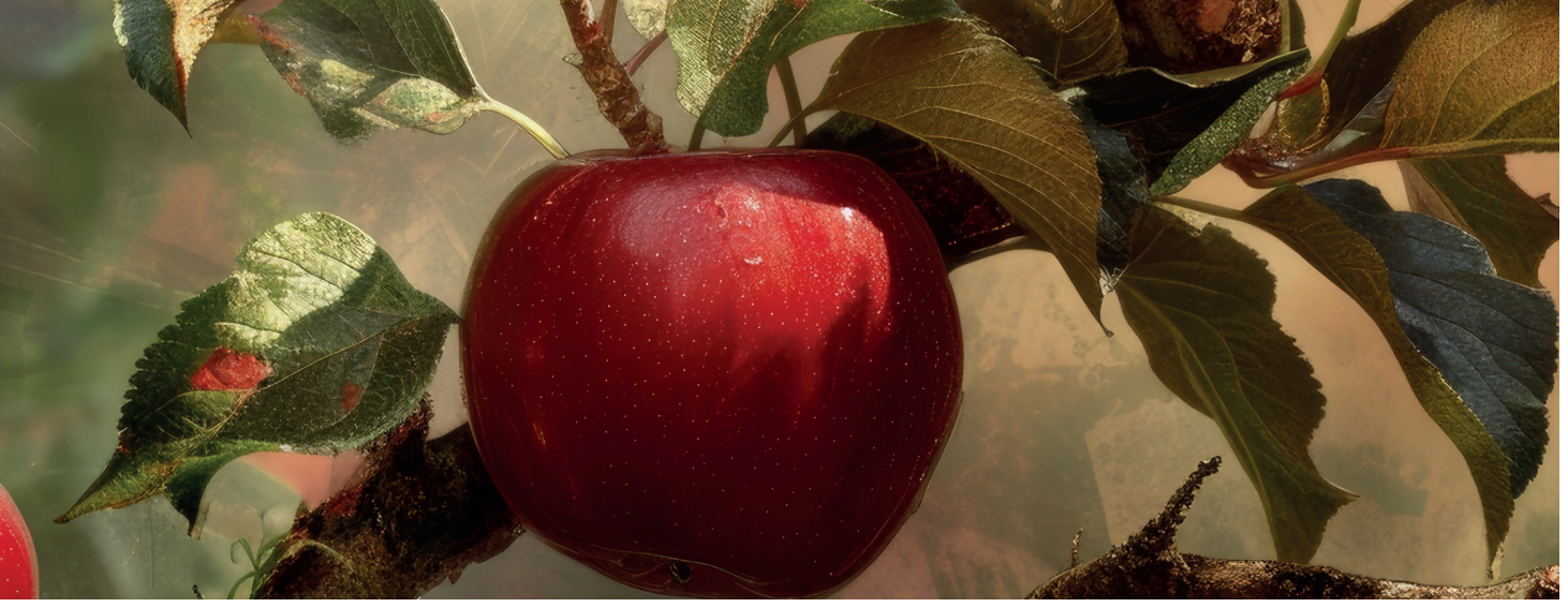
ELMA İÇ KURDU APPLE BORER (CYDIA POMONELLA)