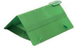
IQ DELTA TRAP

These pheromones can also be used in organic farming practices.