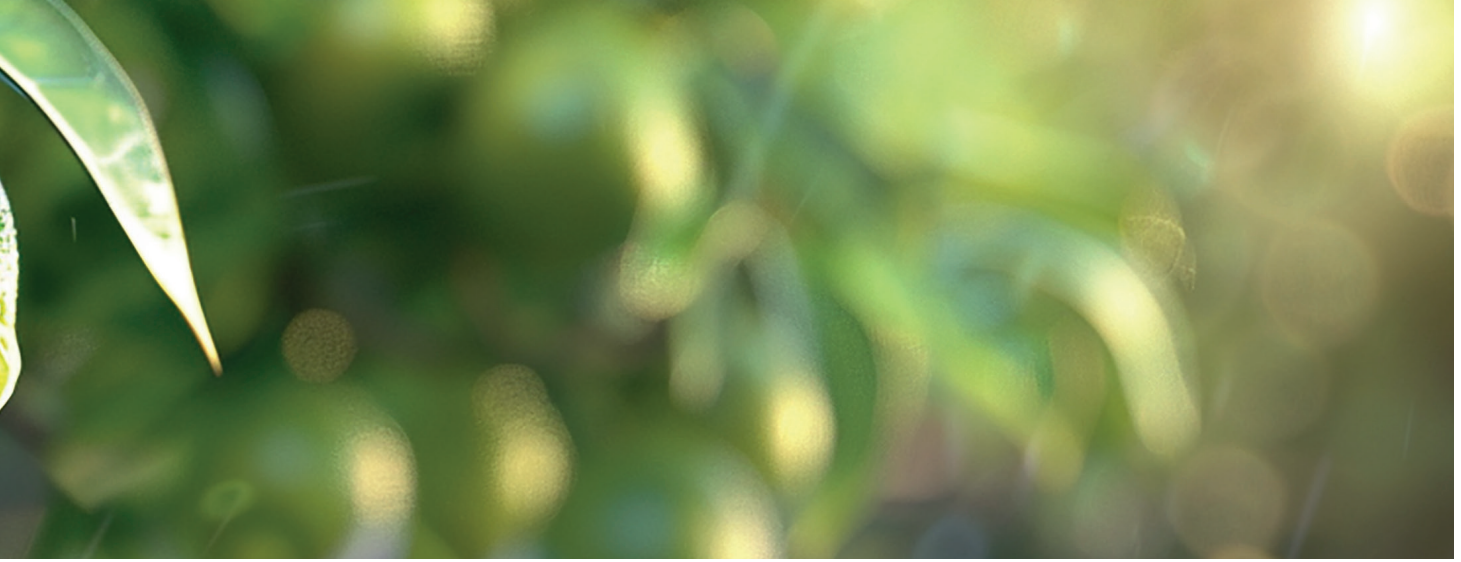
TURUNÇGİL UNLU BİTİ THE MEDITERRANEAN FRUIT FLY (PLANOCOCCUS CITRI)