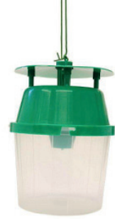
IQ UNI TRAP