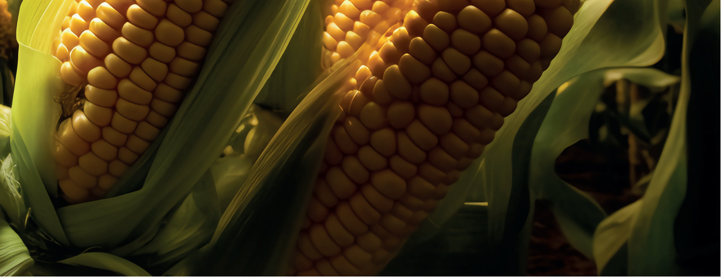
GÜZ TIRTILI THE AUTUMN CATERPILLAR (SPODOPTERA FRUGIPERDA)