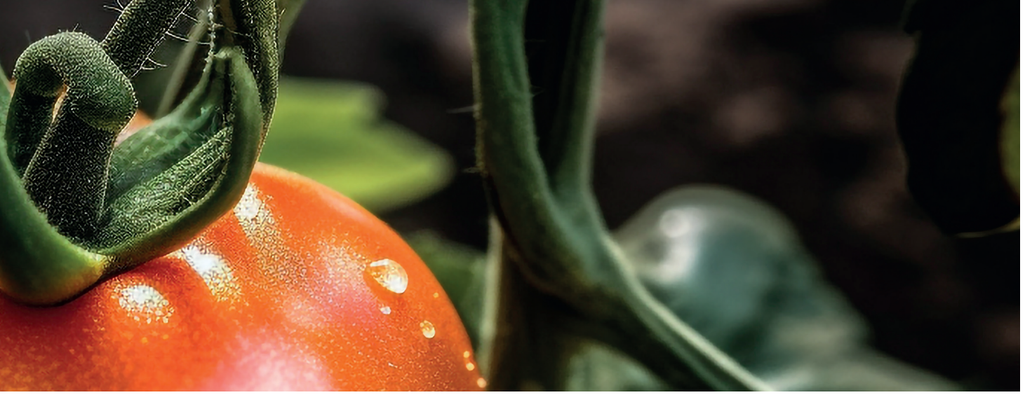
DOMATES GÜVESİ TOMATO MOTH (TUTA ABSOLUTA)